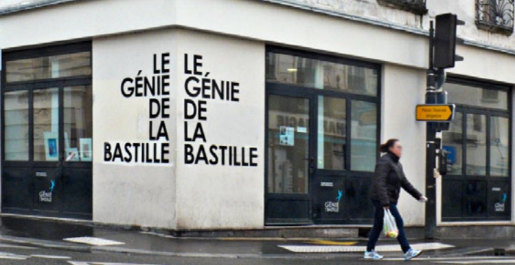
La Galerie du Génie 126, rue de Charonne 75011 06 26 57 28 36 - 09 51 30 99 63

En 1984, l'association Le Génie de la Bastille initie de façon inédite les premières portes ouvertes d'ateliers d'artistes à Paris. Aujourd'hui, elle propose au public la deuxième édition du Génie en Liberté, parcours artistique dans le 11 e .