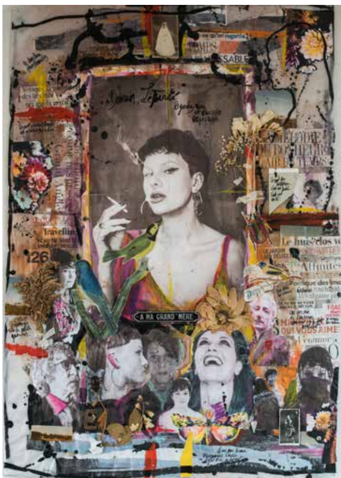
Collages sur claque 100x70cm - Pièce originale encre, végétaux, aquarelle, photographies