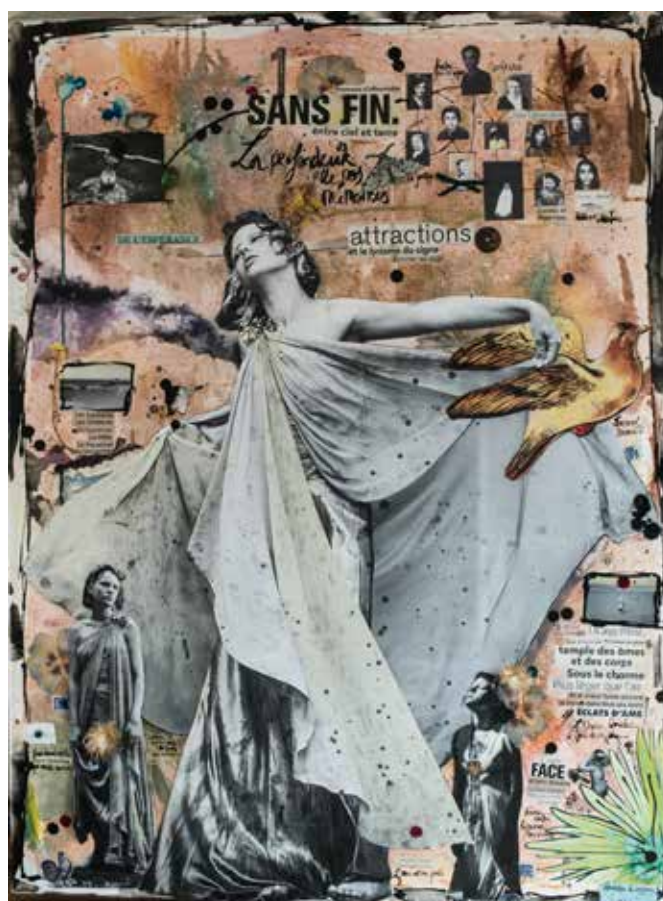
Collages sur toile 120x90cm - Pièce originale encre, végétaux, aquarelle, photographies