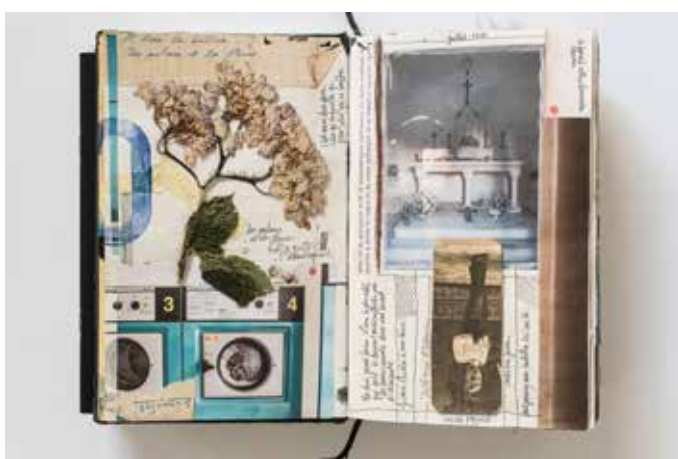
Carnets Pièce originale encre, végétaux, aquarelle, photographies